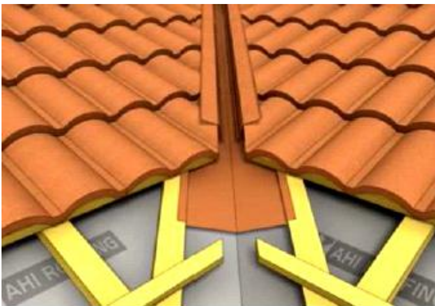
Montáž úžľabia pre profile MILANO

Rez profilu MILANO je pritom v úžľabí zakrytý tzv. úžľabovým krytom, ktorý sa kotví na zastrihnuté šablóny pomocou systémových samorezných vrutov. (viď. obrázok)