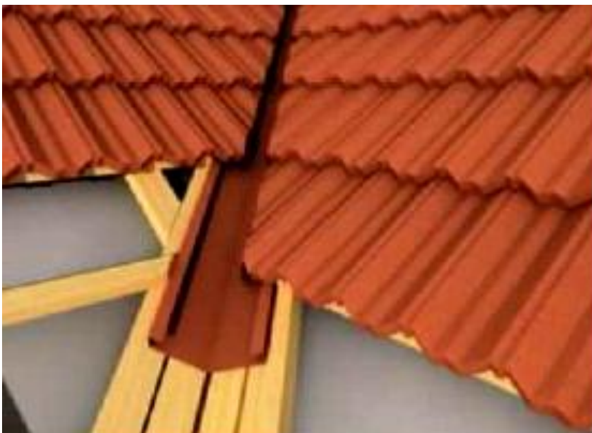
Montáž úžľabia – celkový pohľad